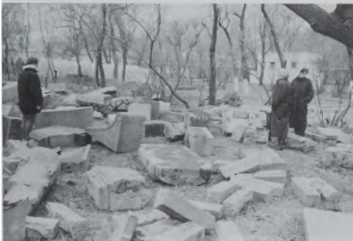
Успенское кладбище 30 лет спустя закрытия, в апреле 1990 г. Ныне здесь Харбинский парк культуры и отдыха