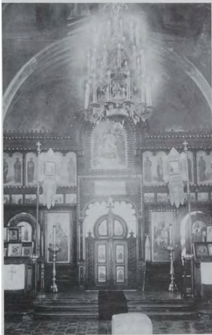
Внутреннее убранство Иверской церкви в Харбине. Фото 1930-х гг.