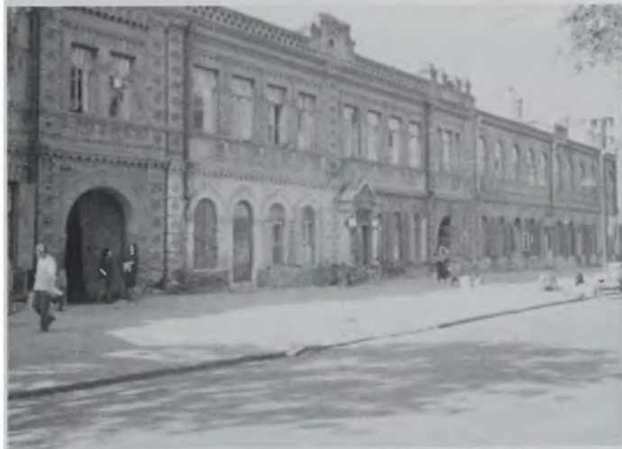
Фрагменты «русской» застройки в Харбине. Фото 1990-х гг.