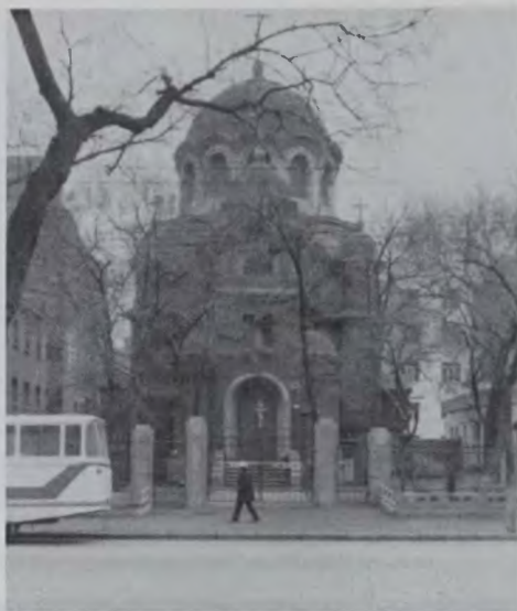
Покровская церковь – единственный ныне действующий в КНР православный храм