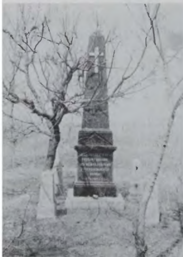
Памятник А.А.Корнильеву (командиру миноносца «Решительный», участнику первого боя с японцами) на Дальнем кладбище. Фото 1990 г.