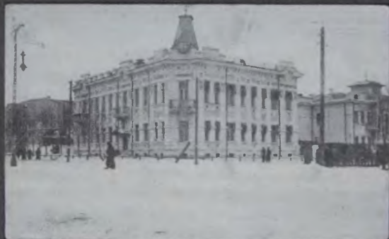
Китайская таможня. Харбин, 1916 г.