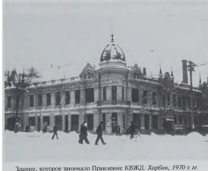
Здание, которое занимало Правление КВЖД. Харбин, 1970-х гг.