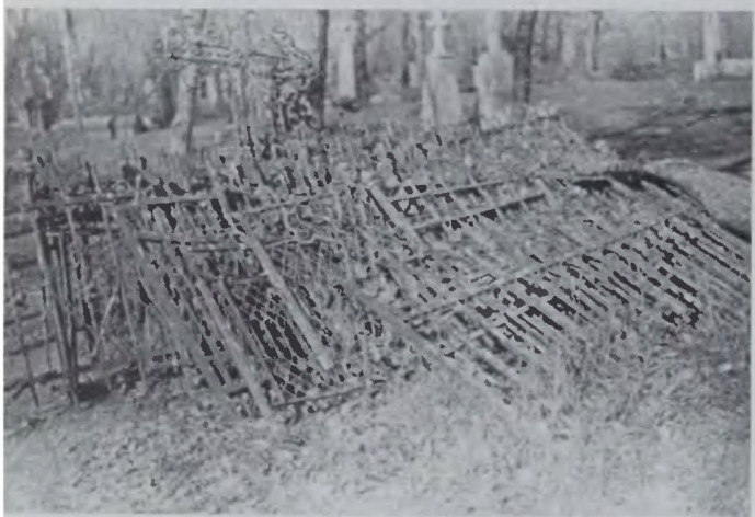
Разрушенное Успенское кладбище. Решетки кладбищенских оград. Последнее захоронение датировано 31 мая 1958 г., кладбище закрыто 1 июня 1958 г. Фото 1990 г.