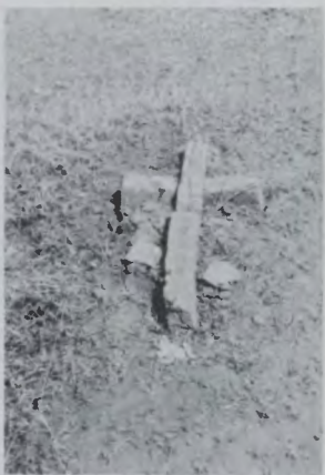
У близких не хватило денег на надгробие. Дальнее кладбище, 1990 г.