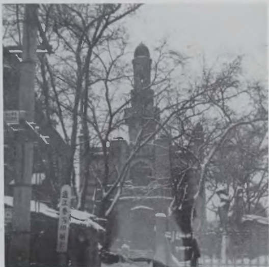
Мечеть российских татар. Фото 1950-х гг.