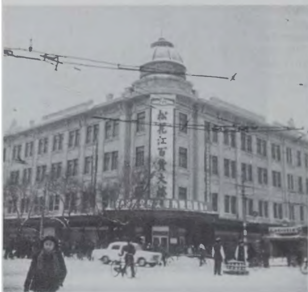
Популярный в Харбине магазин Н. Г. Чурина. Фото 1970-х гг.