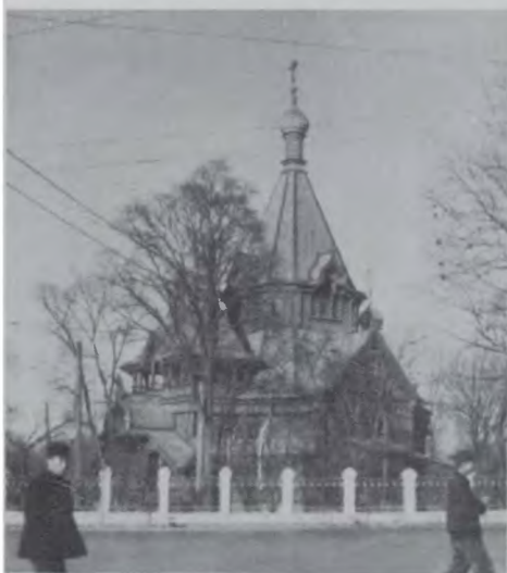
Свято-Николаевский собор – любимый собор Харбинцев. Построен в 1897–98 гг., сожжен хунвейбинами 23 августа 1966 г. Фото серед. 1950-х гг.