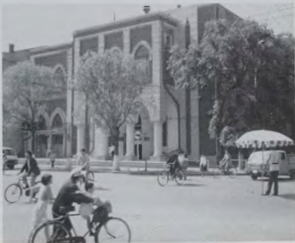
Внизу: «Новая» синагога. Харбин, 1990 г.