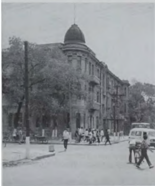
Слева: Фрагмент «русской» застройки Харбина. Фото 1990 г.