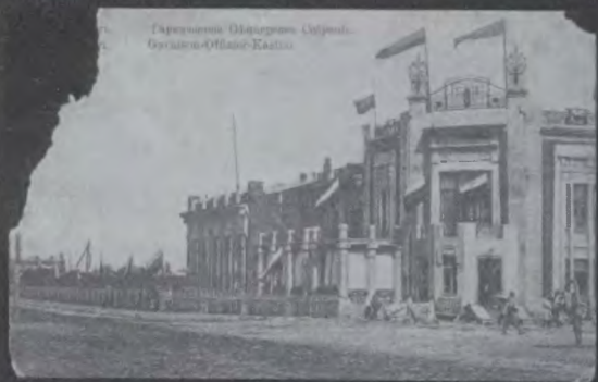
Гарнизонное Офицерское Собрание. Харбин, 1913 г.