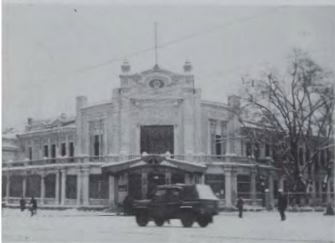
Бывший дом И.Ф. Чистякова в Харбине. Фото 1970-х гг.