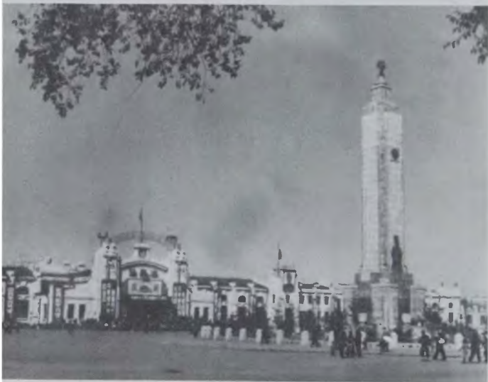
Вокзал и привокзальная площадь Харбина. Фото середины 1950-х гг.