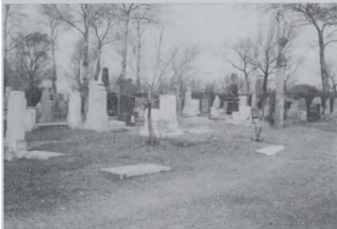
Около 100 могил с Успенского кладбища были перенесены на Успенско-Предтеченское кладбище (так называемое «Дальнее») на окраине Харбина. Фото 1990 г.