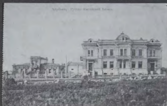
Русско-китайский банк. Харбин, 1910 г.