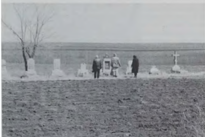
Последние русские харбинцы у последних родных могил. Дальнее (Успенско-Предтеченское) кладбище, май 1990 г.