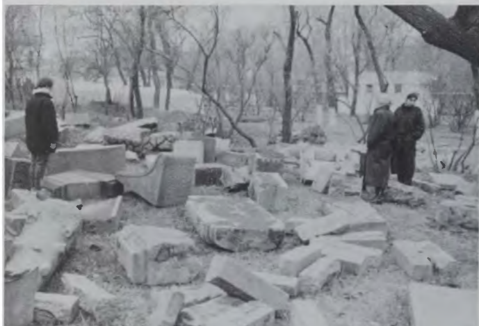
Разрушенное Успенское кладбище в Харбине (так называемое «Новое» на Большом проспекте). Фото 1990 г.