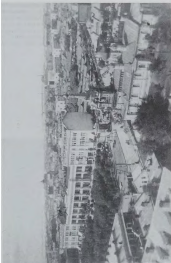
Пристань. Вид с лесов достраивавшегося Нового Софийского Храма Харбин, 1930 г.