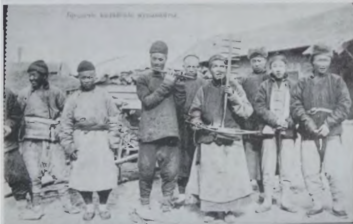
Бродячие китайские музыканты. Открытка начала XX в.